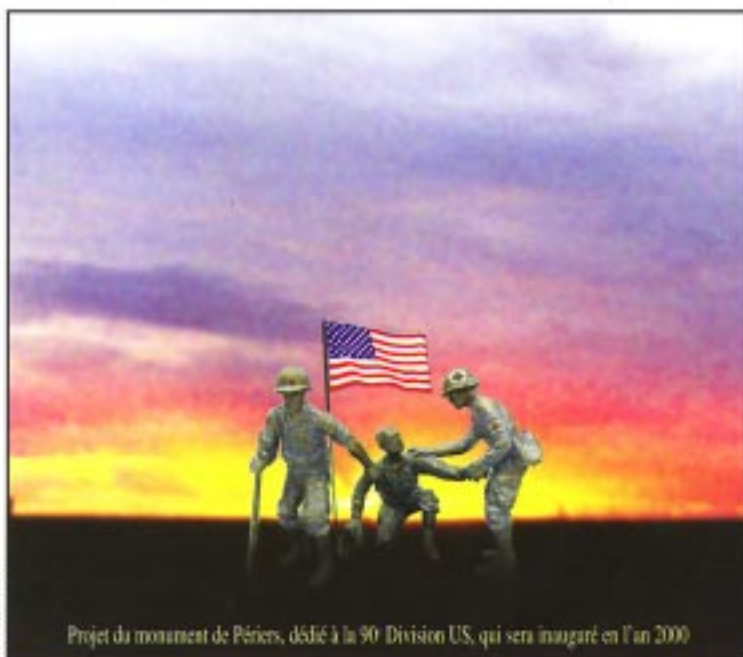
Projet du monument de Périers, dédié à la 90 e Division US, qui sera inauguré en l'an 2000

Le 6 juin 1944 à Utah-Beach, deux bataillons du 359 e Régiment renforcent l'effectif d'assaut de la 4 e Division d'Infanterie. Le reste de la Division débarque les 7 et 8 juin. La progression se fera vers Montebourg pour les éléments attachés à la 4 e , tandis que les autres unités